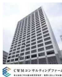
CWM コンサルティングファーム

JR 大宮駅西口から徒歩 5 分。 お車でのご越しの際は近隣の有料駐車場をご利用ください。